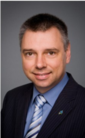
Photo de André Bellavance

Les droits à l'information, à la culture et au loisir pour les personnes en situation de pauvreté sont violés par cette décision.